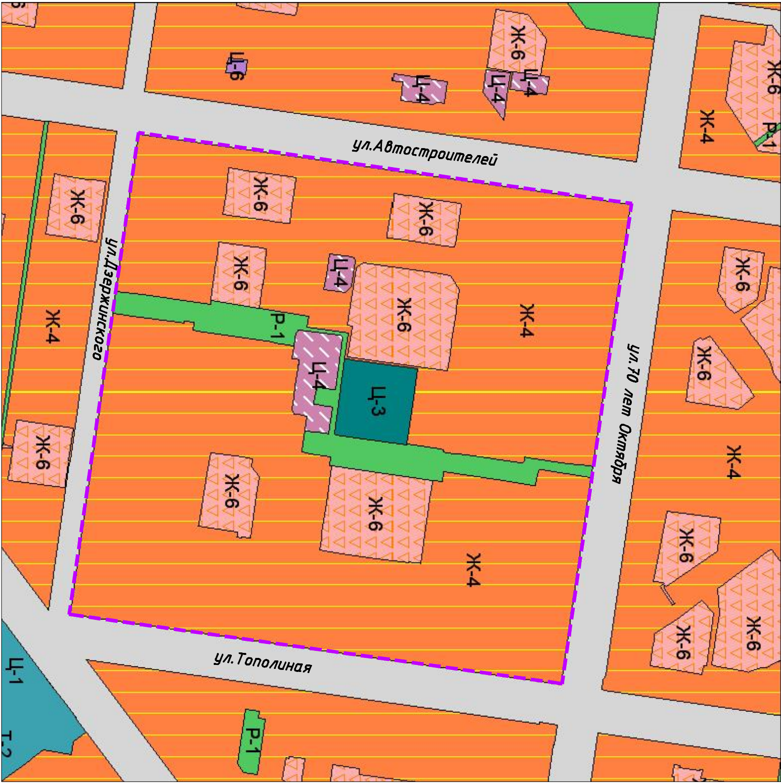
Схема расположения элемента планировочной структуры (в соответствии с Правилами землепользования и застройки города Тольятти)